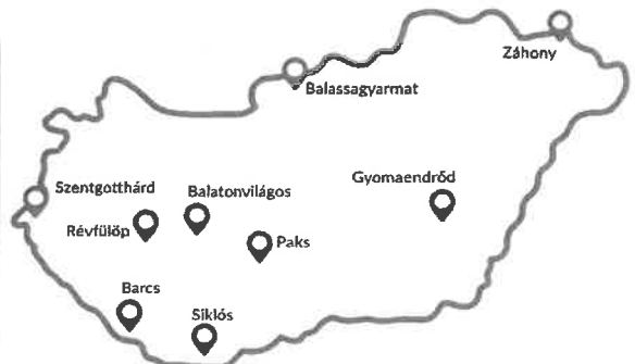
A mérőhálózat tervezett telephelyei

A különféle (elsősorban digitális) rádiós technológiák fejlődése, valamint a használt frekvenciatartomány bővülése miatt a hatóságnak fejlesztenie kell a mérőhálózatát, hogy lépést tartson a változásokkal, és felelős gazdaként felügyelhesse a magyar frekvenciavagyon előírásoknak megfelelő hasznosítását. A rádiómegefigyelő hálózat új elemei olyan kisméretű, egyszerű felépítésű, könnyen telepíthető és alacsony fogyasztású mérőállomások lesznek, amelyeket az ország kilenc további, rádióforgalom szempontjából jelentős városában tervezünk elhelyezni.