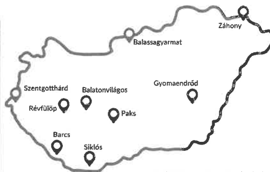
A mérőhálózat tervezett telephelyei

A különféle (elsősorban digitális) rádiós technológiák fejlődése, valamint a használt frekvenciatartomány bővülése miatt a hatóságnak fejlesztenie kell a mérőhálózatát, hogy lépést tartson a változásokkal, és felelős gazdaként felügyelhesse a magyar frekvenciavagyon előírásoknak megfelelő hasznosítását. A rádiómegfigyelő hálózat új elemei olyan kisméretű, egyszerű felépítésű, könnyen telepíthető és alacsony fogyasztású mérőállomások lesznek, amelyeket az ország kilenc további, rádióforgalom szempontjából jelentős városában tervezünk elhelyezni.