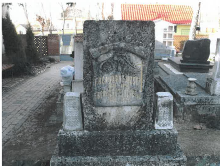
A helyreállítás után: