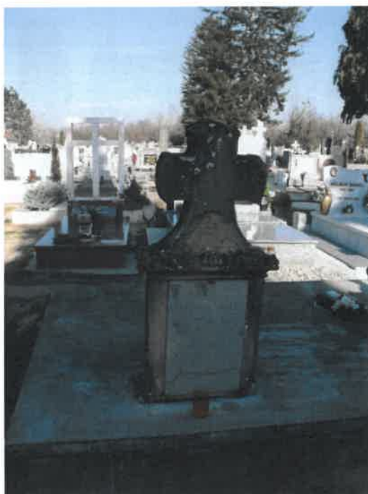
A helyreállítás után: