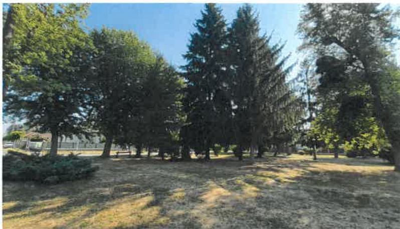
A köztéri alkotás a meglévő facsoport elé tervezett

A szobor elhelyezésére javasolt helyszín a Möricz Zsigmond Művelődési Központtól északra lévő közpark sarka ( hrsz.: 896 ) az Ifjúság és a Gagarin utca sarka.